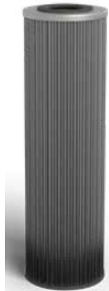
精密ろ過フィルター