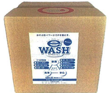
e-WASH 20L バックインボックス

e-WASHは水道水を電気分解して生成します。RO膜で分子レベルの不純物を除去した純水を原料にして食品添加物グレードなどの炭酸カリウムを電解質として、独自の陽イオン交換膜を用いて生成されます。生成水は溶存水素濃度の高い強アルカリ性の電解水です。成分は99.83%純水、0.17%が水酸化カリウムで構成されます。pH12.5の水素イオンが充満している強アルカリの作用によって合成界面活性剤にも劣らない優れた洗浄効果があり、油脂を乳化する特性を持ちます。感染予防として重要要素となる湿度の維持、飛沫や足元から往来するウイルスへの衛生対策が求められる中、「限りなく水に近い」e-WASHは人への刺激がなく「加湿」としてご利用いただく事の出来る優しい機能水です。e-WASHは洗浄と除菌効果によるウイルス感染予防に広く活躍しております。